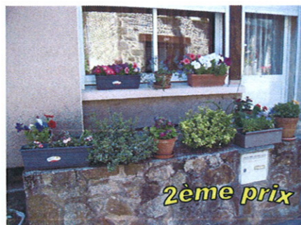
Mme WYSZYWANIWCKI Fabienne